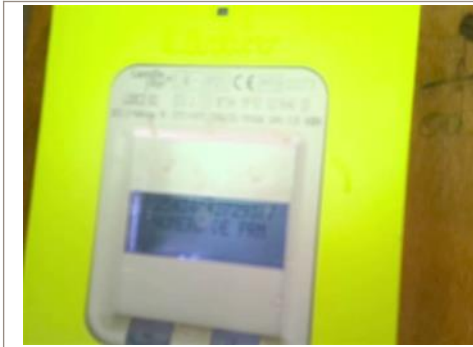
Photo du compteur ou tableau électrique