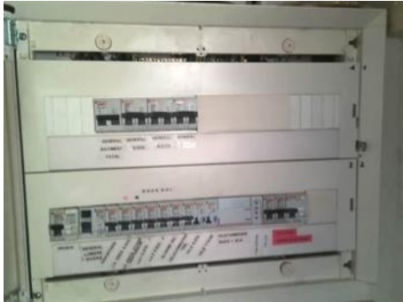
Photo du compteur ou tableau électrique