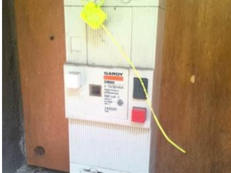
Photo du compteur ou tableau électrique