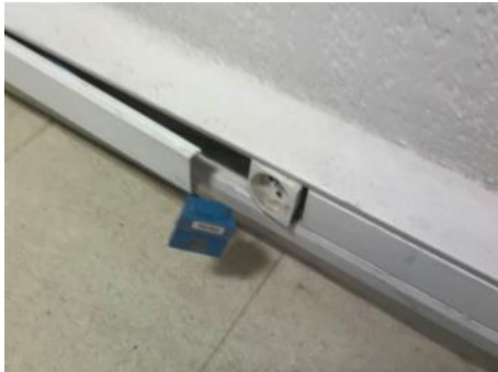
Libellé de l'anomalie : B.7.3 a L'enveloppe d'au moins un matériel est manquante ou détériorée.