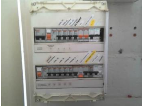
Photo du compteur ou tableau électrique