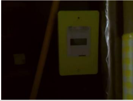
Photo du compteur ou tableau électrique