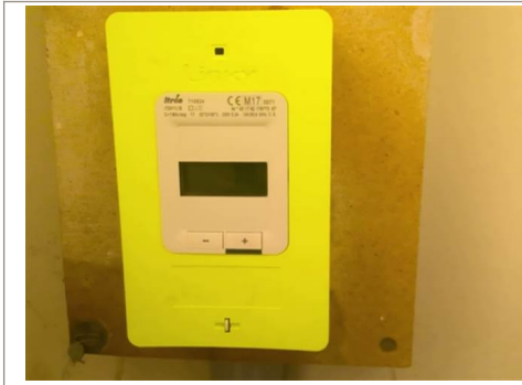
Photo du compteur ou tableau électrique