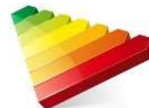
Tableau récapitulatif de la méthode à utiliser pour la réalisation du DPE :