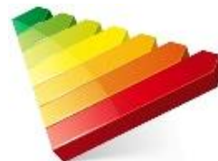
Tableau récapitulatif de la méthode à utiliser pour la réalisation du DPE :