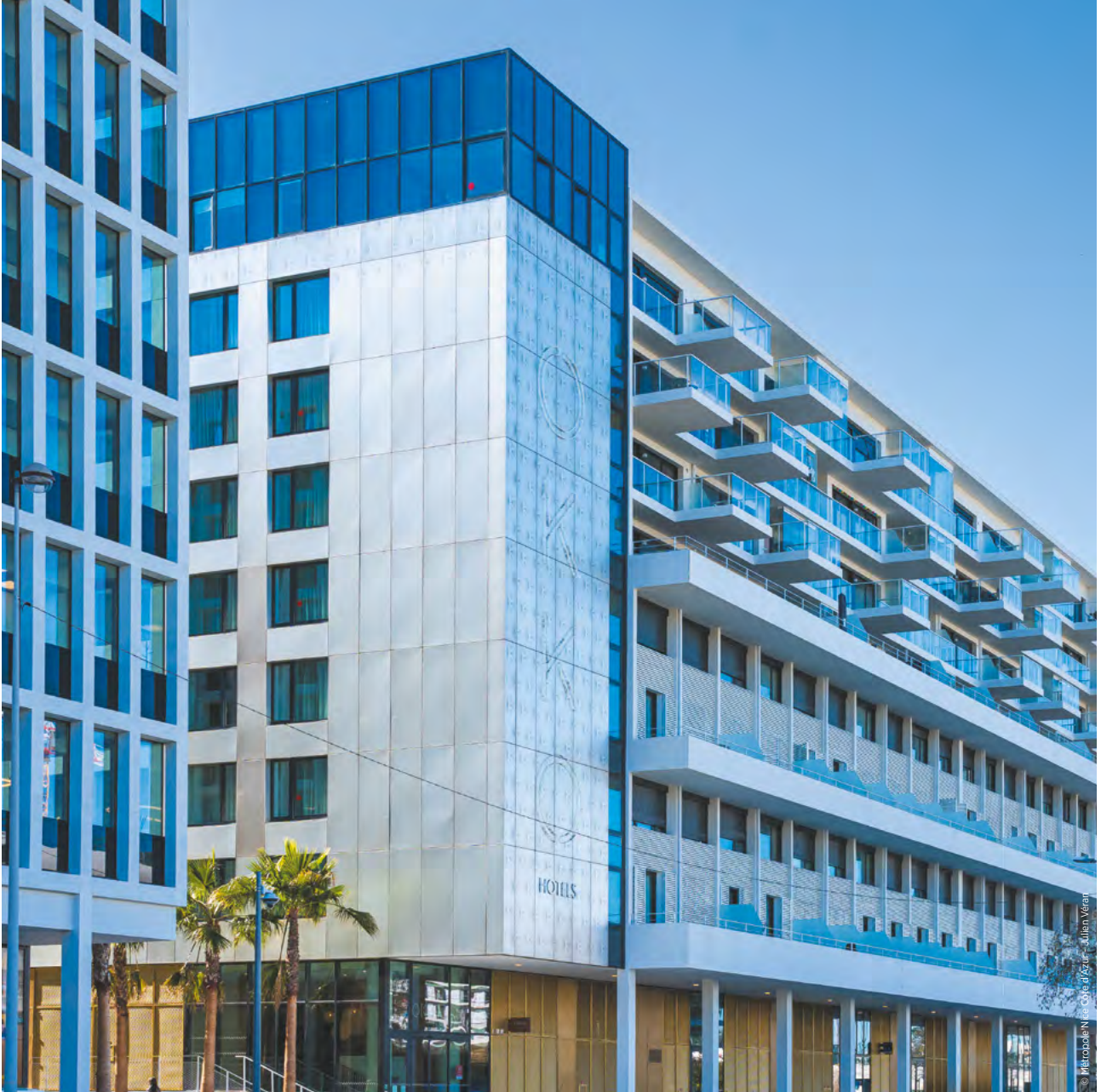
© Marianne Nilsa Cole of Azura - Julien Veran