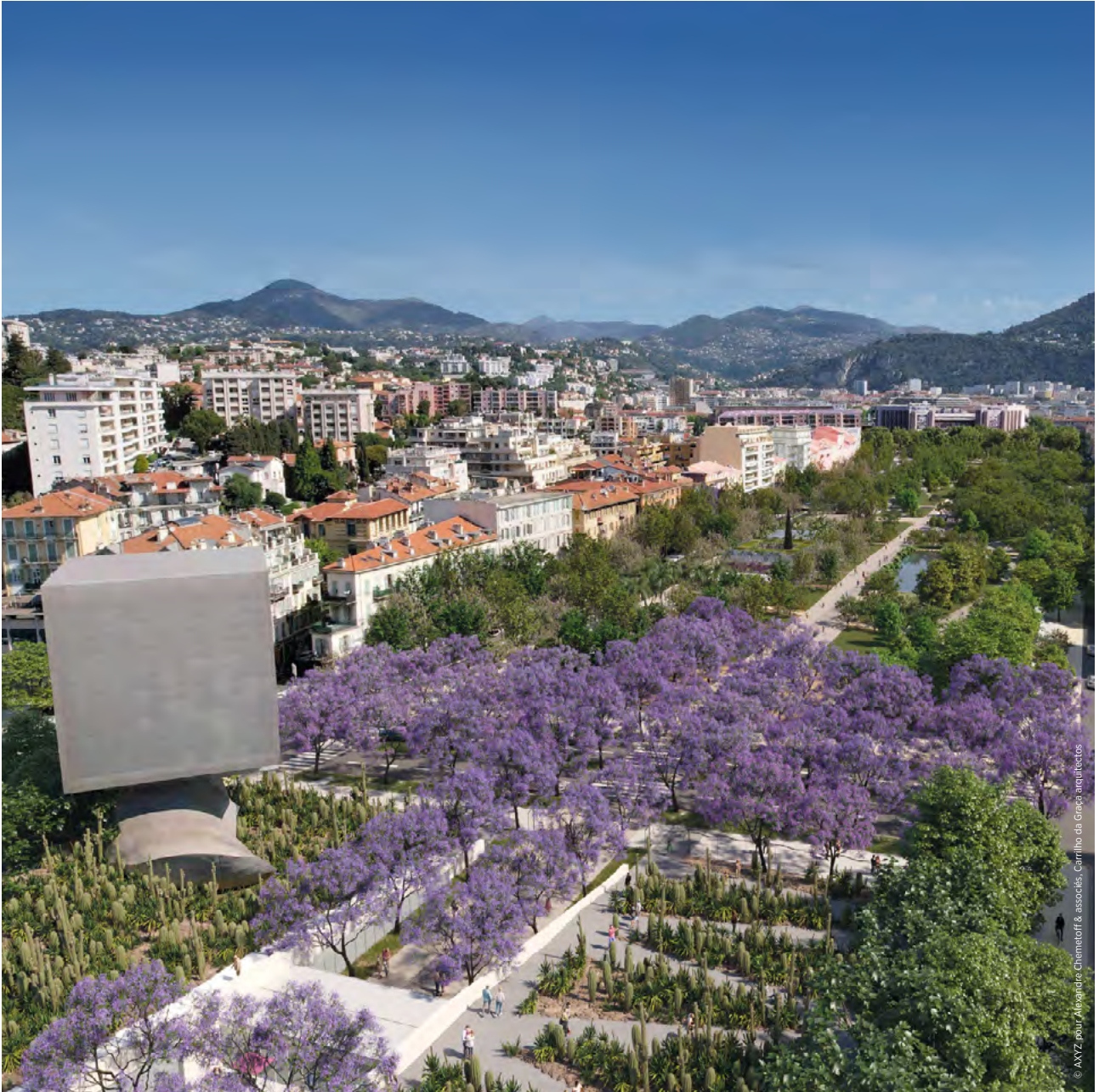
© AXZ pour Alexandre Chemetoff & associés, Camilho da Graça arquitectos